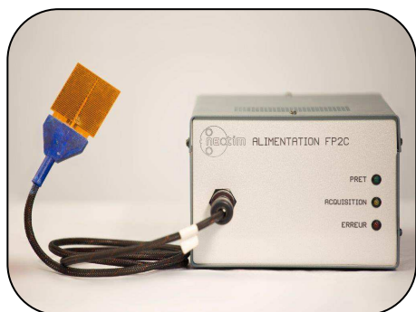
Illustration du Conductivimètre Fil Chaud (Photo non contractuelle)

Le conductivimètre fil chaud peut être complété d'une sonde plan chaud (estimation de l' effusivité thermique ), d'une sonde anneau chaud (estimation de la diffusivité thermique ) et de leurs logiciels associés.